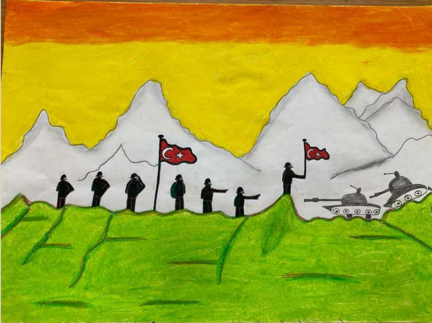
Ayşe Gülsüm ÖLGÜN