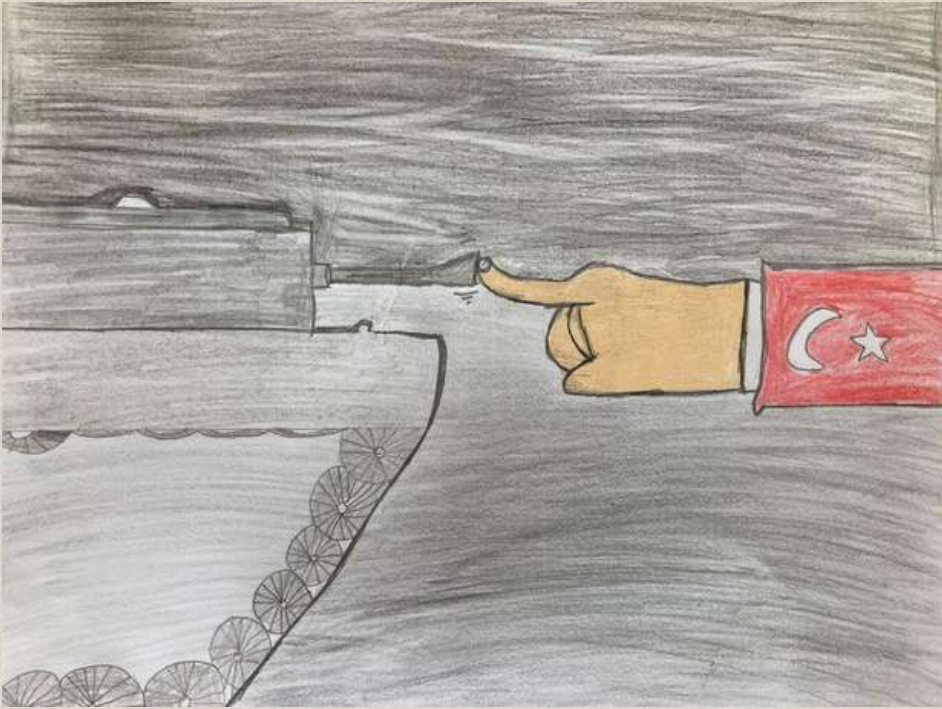
Samet TEMEL 7/A