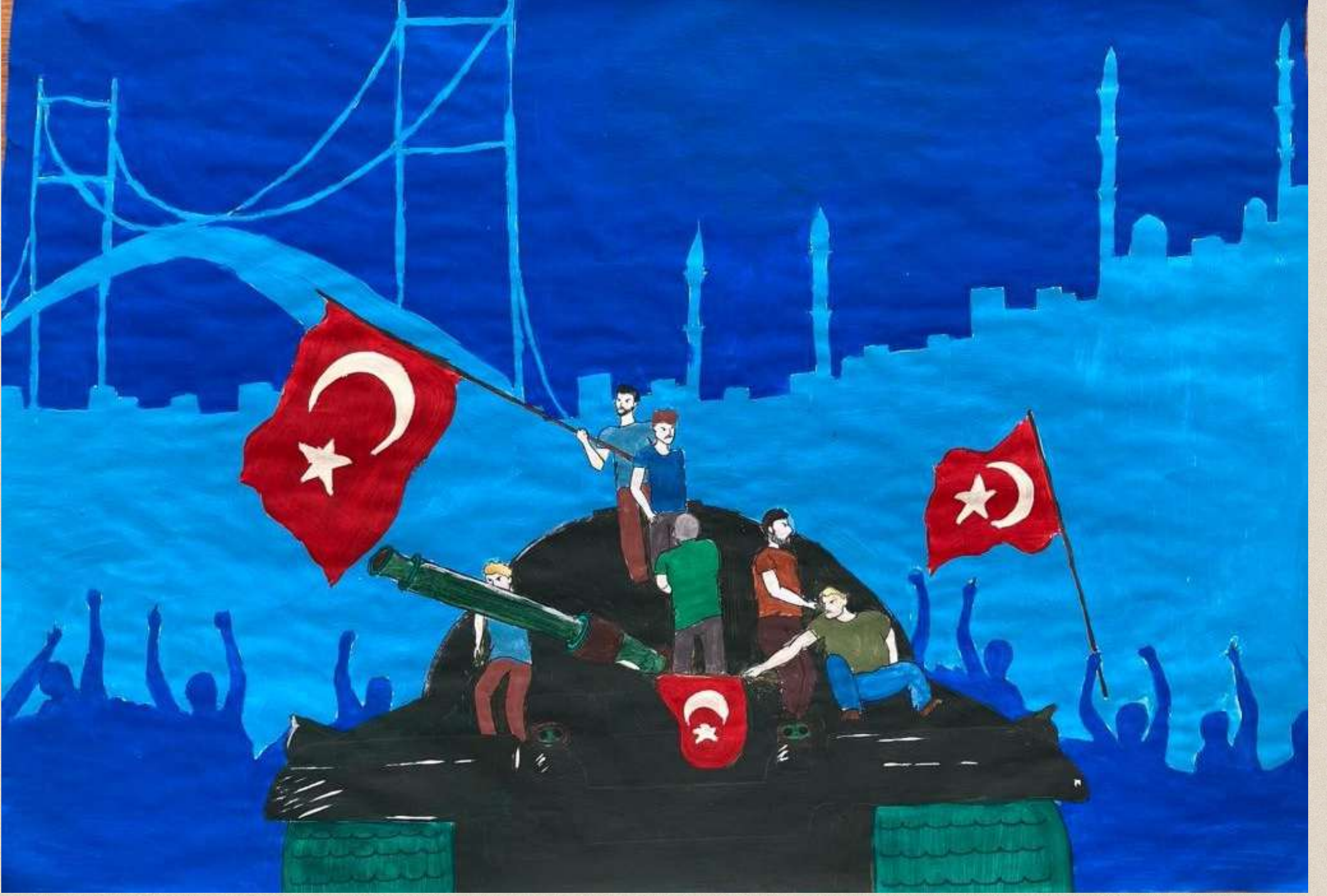
Pelin TEMİZ 7/B